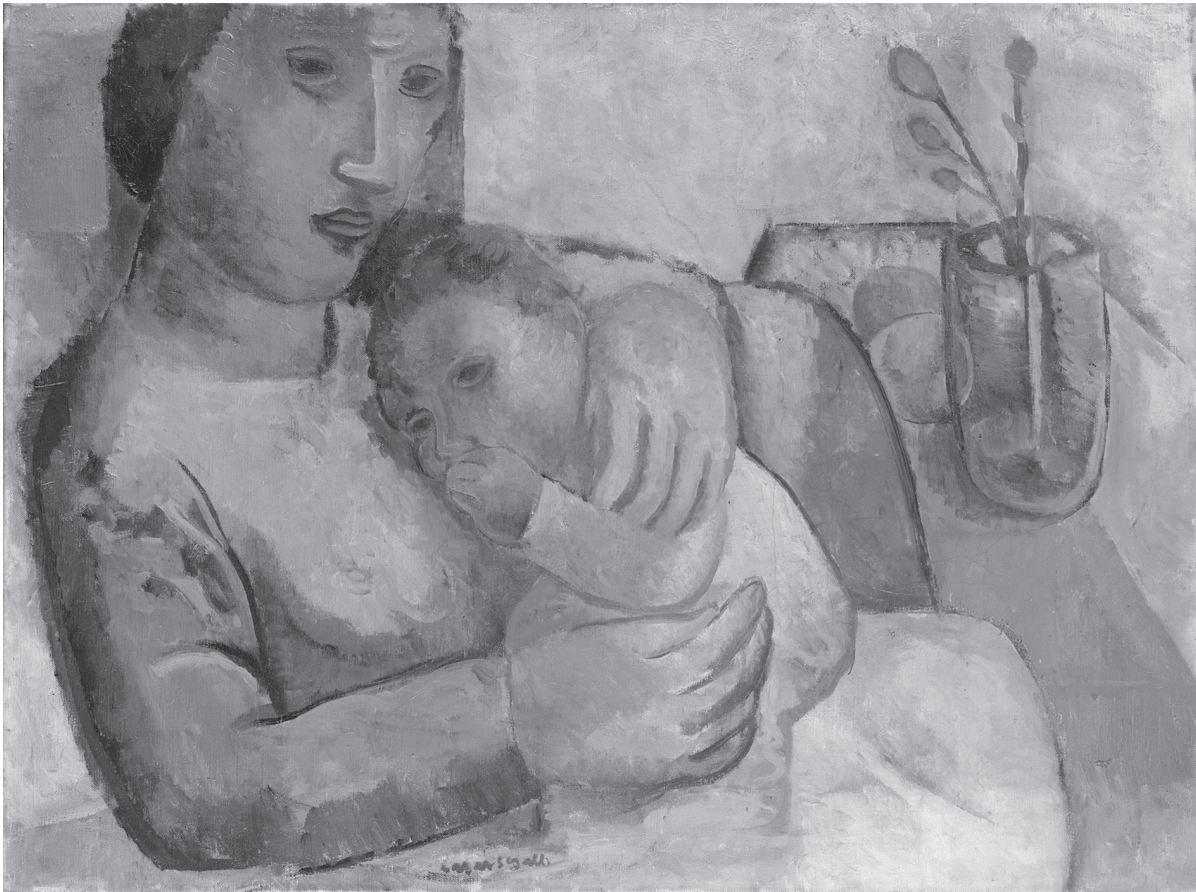
Lasar Segall. Maternidade . Óleo sobre tela, 54 x 73cm, 1931. Acervo do Museu Lasar Segall – IBRAM/MinC

Foi proposto um exercício de observação 16 a partir de algumas questões, como, por exemplo: onde está mais iluminado, contraste de cores, quantas figuras há na tela, visualização das linhas que definem as figuras, expressão das figuras. E logo após foi pedido para que C. e D. inventassem uma história daquela imagem, daquelas personagens.